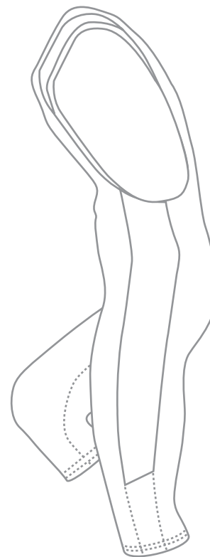
Art. 602 3/4