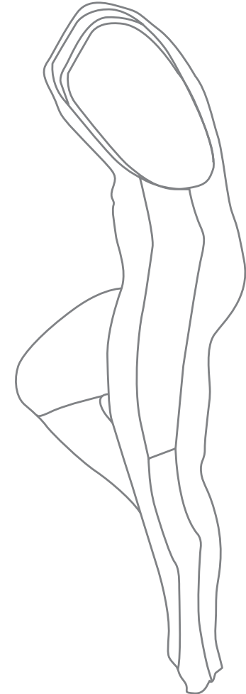
ART. 600 SALOPETTE