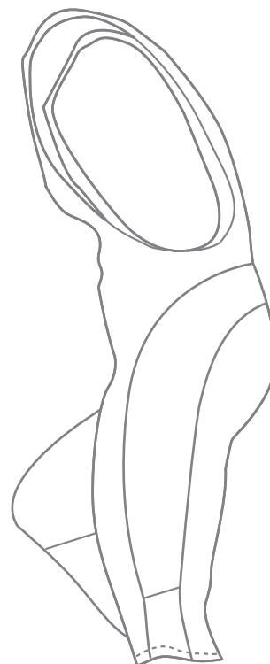
ART. 502 3/4